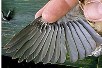
23 dagen. Uitvliegdag. Code N7.