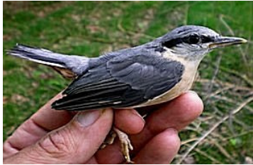
23 dagen. Uitvliegdag. Code N7.